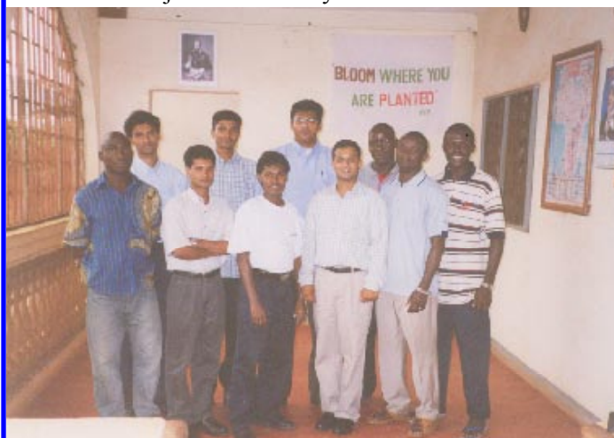
MSFS Studenten in Yaoundé